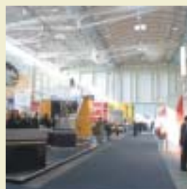
Halle d'exposition à Hamburg; Architecte: Ingenhoven, Düsseldorf