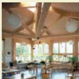
Jardin d'Enfants en Würenlos. Architecte : Alois Wiedemeier, Würenlos (CH)