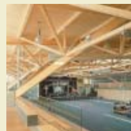
Salle polyvalente à Essenbach (D) Architecte : Manfred Fetscher, Illmensee