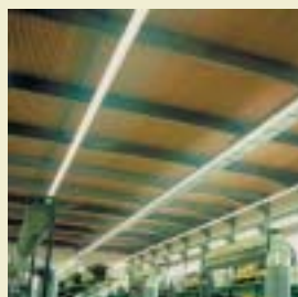
Bâtiment Industriel à Murg (D) Conception : Ingenieurbüro Bröder, Weilheim