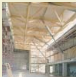
Salle polyvalente à Hawangen. Architecte : M. Fetscher, Illmensee