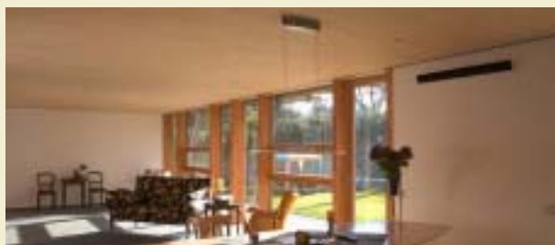
Logement avec atelier en Dietingen. Architecte : Roland Scharr, Leinfelden