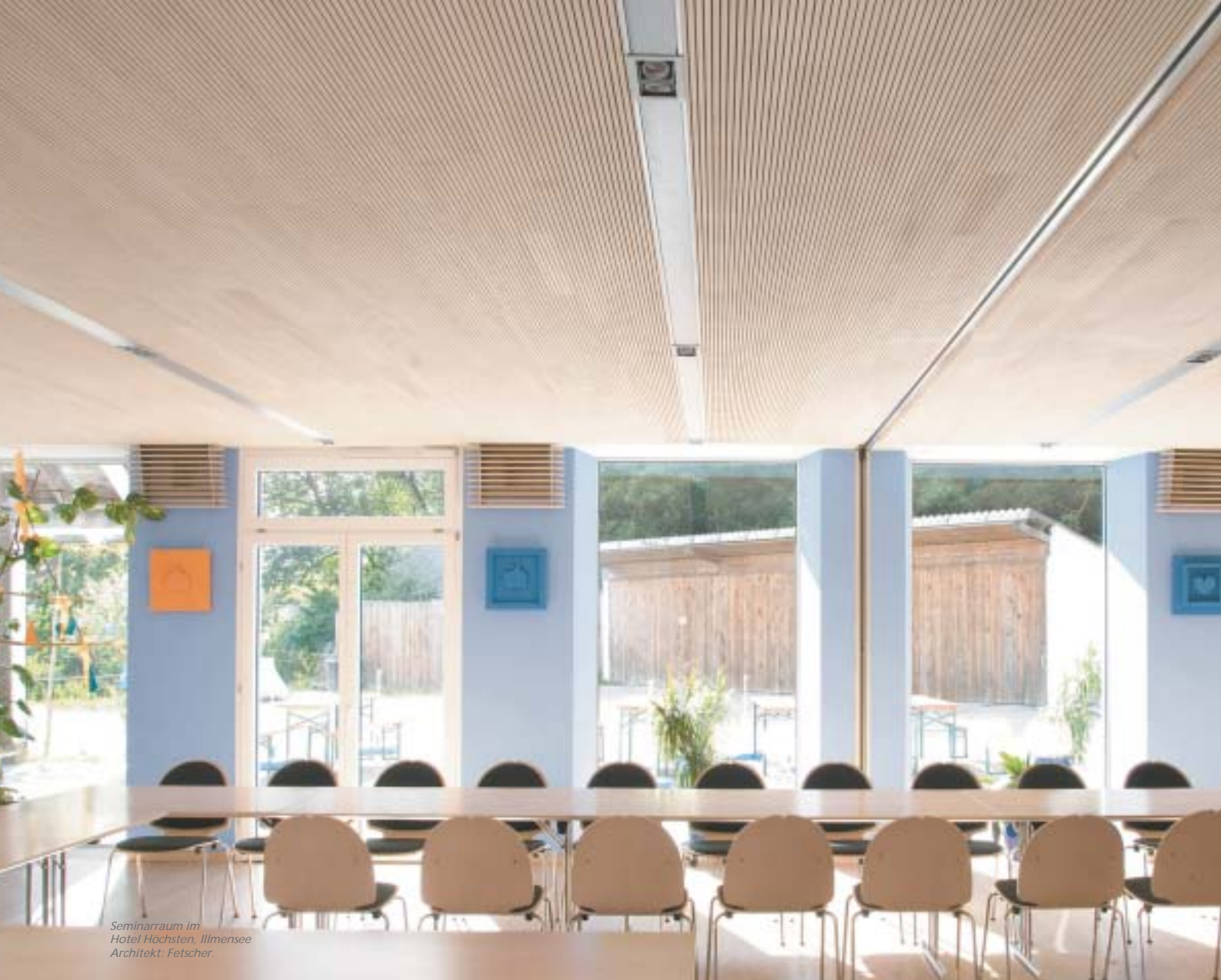
Seminarraum im Hotel Hochsten, Illmensee Architekt: Fetscher.