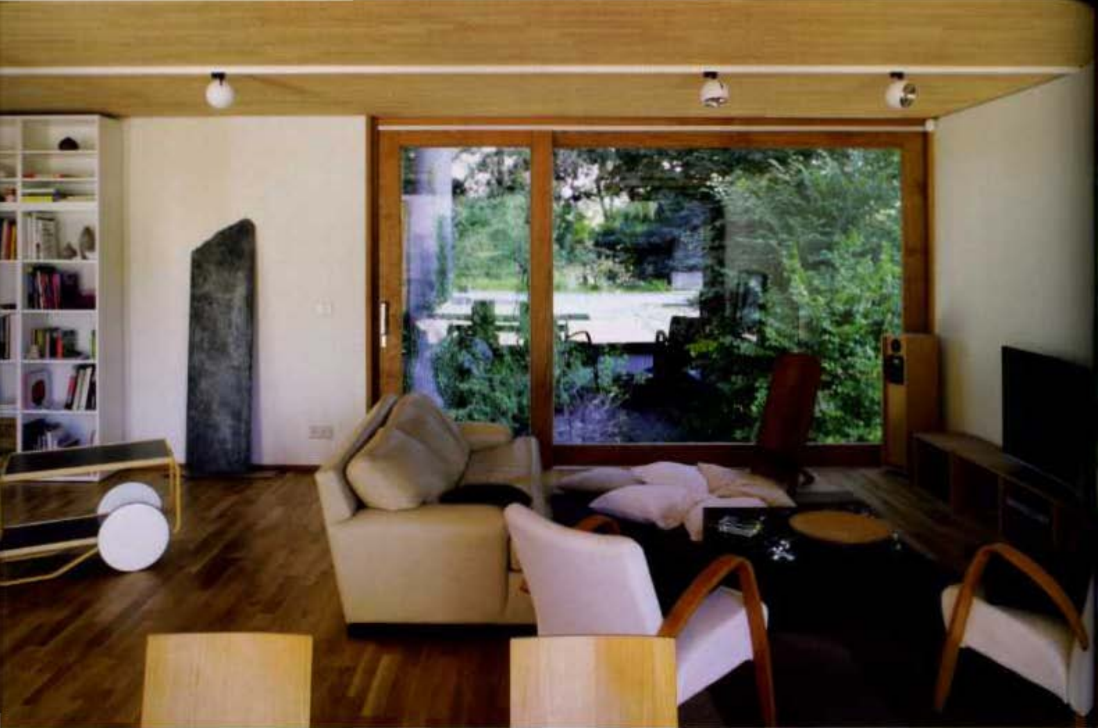
Salon et séjour se développent dans un même volume largement ouvert sur les deux jardins et bénéficiant d'une luminosité idéale. La cuisine, espace simple et efficace, s'installe discrètement dans l'alle latérale.